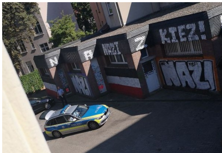
Tatort: Emscherstraße (Farbe: pink)