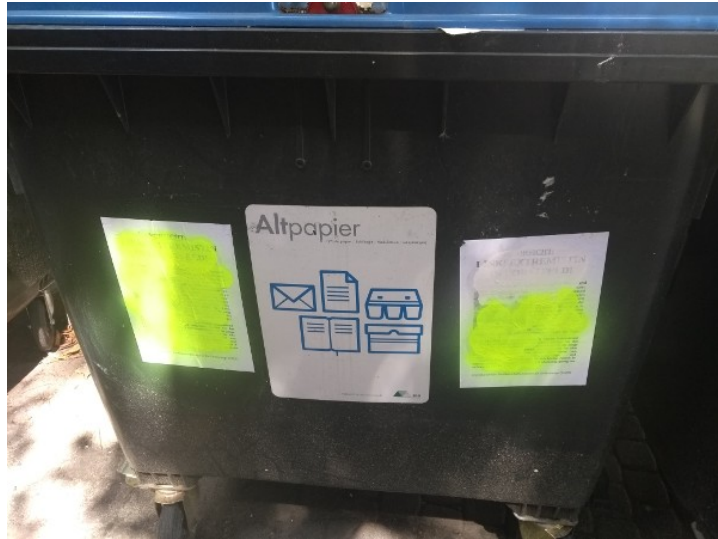
Tatort: Thusneldstraße (Farbe: Neongelb)